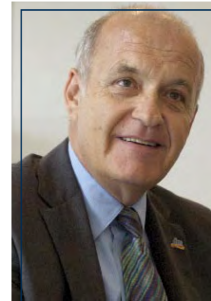
Professor Götz W. Werner

Industrialisierung und Arbeitsteilung führen zur Standardisierung von Prozessen und zunehmender Automation. Die Fähigkeit bzw. Notwendigkeit für Unternehmen, Erwerbseinkommen zu generieren, nimmt dadurch ab