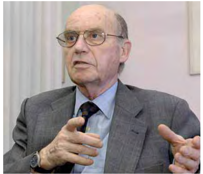
Dr. Hardorp macht lieber Wirtschaftsberatung als Steuer-Klein-Klein.

Werner: Kaum. Derzeit ist es doch eher umgekehrt: Unser enorm hohes Niveau an Infrastruktur und Sozialleistung verteuert unsere Exporte, gleichzeitig werden Güter importiert, die steuerlich nicht in vergleichbarer Höhe belastet sind. Heute belasten wir den Export und subventionieren den Import.